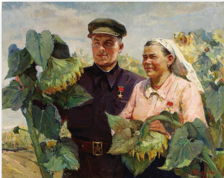
«Герои Социалистического труда», 1951 г.

К началу 1977 года звание Героя Социалистического Труда было присвоено 18 287 советским гражданам , из которых свыше ста человек награждены двумя медалями «Серп и Молот».