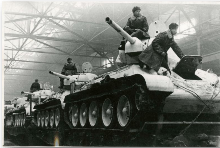
T-34 на жд-платформах