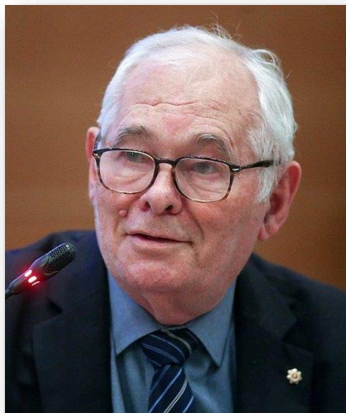
Рошалъ Леонид Михайлович